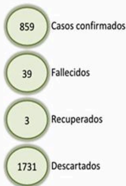
Figura 1. Casos sospechosos de COVID-19 según fecha de reporte y resultado de laboratorio. República Dominicana, 28/03/2020

En relación a los fallecimientos, la mediana de edad es de 60 años, el 74% (29/39) eran hombres.