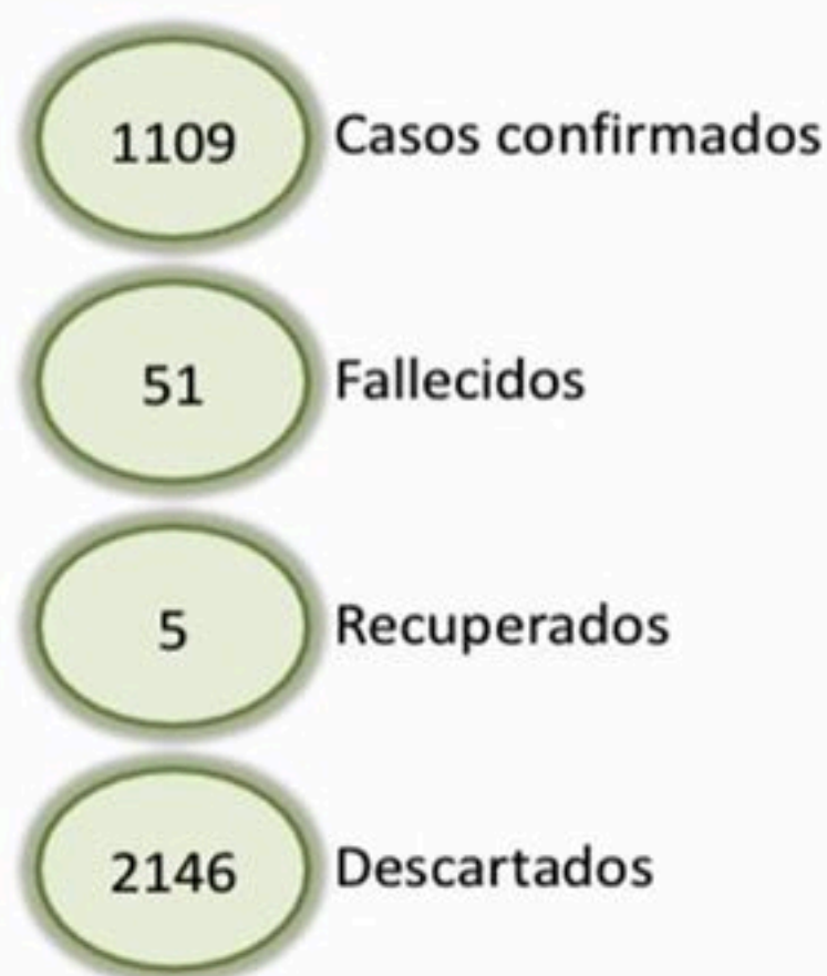
Figura 1. Casos confirmados de COVID-19 según fecha de confirmación. República Dominicana, 30/03/2020

Hasta la fecha, del total de casos sospechosos reportados al SINAVE, el 66% (2146/3255) fueron descartados por laboratorio. Otros 24 casos sospechosos están en espera de resultados.