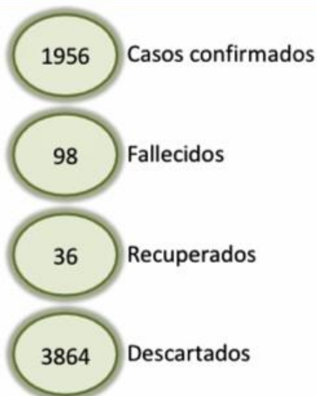
Figura 1. Casos confirmados de COVID-19, según provincia de residencia. República Dominicana, 06/04/2020