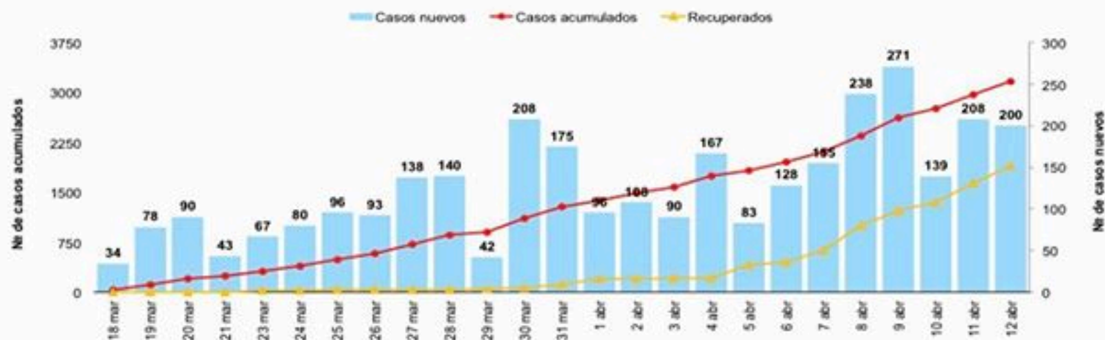
Figura 1. Casos confirmados de COVID-19 nuevos y acumulados por día. República Dominicana, 12/04/2020

El 55% (1741/3167) de los casos confirmados son hombres. Por lugar de residencia, la tasa de incidencia acumulada (IA) por 100000 habitantes es mayor en Duarte (100.4), Distrito Nacional (90.9), Hermanas Mirabal (59.7), La Vega (48.6), Monseñor Nouel (45.3), Santiago (38.6). Y Sánchez Ramírez (38.2). La positividad en las muestras procesadas en las últimas cuatro semanas es del 31%.