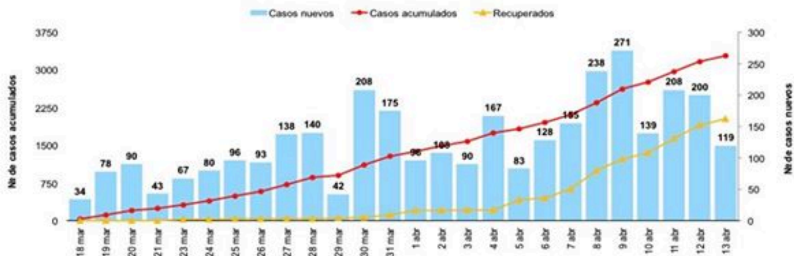
Figura 1. Casos confirmados de COVID-19 nuevos y acumulados por día. República Dominicana, 13/04/2020

El 55% (1810/3286) de los casos confirmados son hombres, de los cuales el 46% (839) tienen 50 años o más. Por lugar de residencia, la tasa de incidencia acumulada (IA) por 100000 habitantes es mayor en Duarte (105.4), Distrito Nacional (91.9), Hermanas Mirabal (62.9), La Vega (50.8), Monseñor Nouel (49.3), Santiago (42.0) y Sánchez Ramírez (38.2).