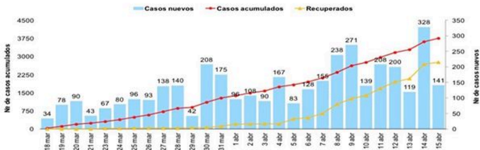
Figura 1. Casos confirmados de COVID-19 nuevos y acumulados por día. República Dominicana, 15/04/2020

El 55% (2060/3755) de los casos confirmados son hombres. Por lugar de residencia, la tasa de incidencia acumulada (IA) por 100000 habitantes es mayor en Duarte (118.8), Distrito Nacional (97.3), Hermanas Mirabal (91.2), La Vega (63.5), Monseñor Nouel (56.8), Sánchez Ramírez (50.0), Santiago (45.5) y Espaillat (43.8).