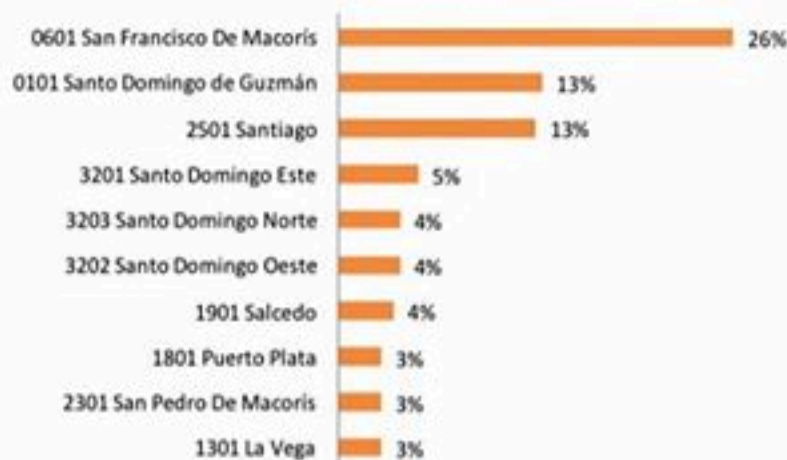
Figura 3. Defunciones por COVID-19, según municipio de residencia. República Dominicana, 20/04/2020.

El 80% (196/245) corresponde a hombres (mediana de edad= 63 años). Entre los antecedentes se reportan hipertensión arterial (25%), diabetes (20%) y enfermedad pulmonar crónica (5%).