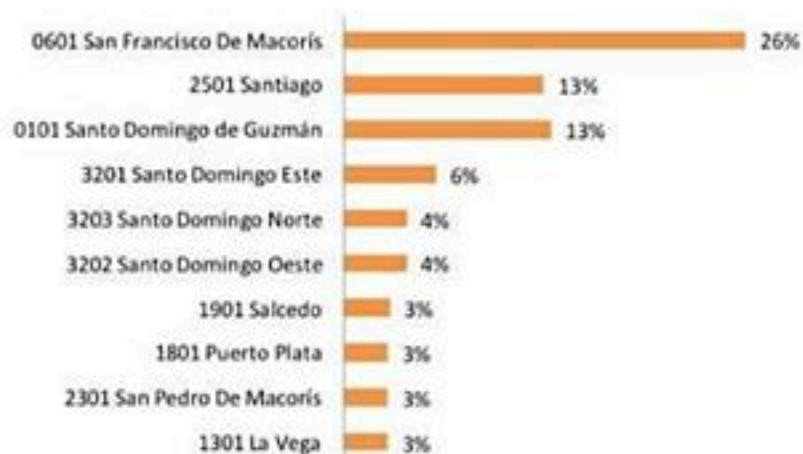
Figura 3. Defunciones por COVID-19, según municipio de residencia. República Dominicana, 21/04/2020.

El 78% (203/260) corresponde a hombres (mediana de edad= 63 años). Entre los antecedentes se reportan hipertensión arterial (26%), diabetes (21%) y enfermedad pulmonar crónica (6%).