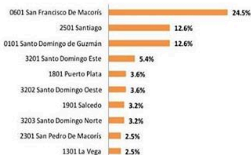
Figura 4. Defunciones por COVID-19, según municipio de residencia. República Dominicana, 25/04/2020.

Entre los antecedentes se reportan hipertensión arterial (31%), diabetes (24%) y enfermedad pulmonar crónica (6%).