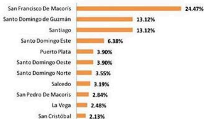
Figura 4. Defunciones por COVID-19, según municipio de residencia. República Dominicana, 26/04/2020.

El 78.01% (220/282) corresponde a hombres. La mediana de edad de los fallecidos es de 64 años. Entre los antecedentes se reportan hipertensión arterial (30%), diabetes (24%) y enfermedad pulmonar crónica (6%).