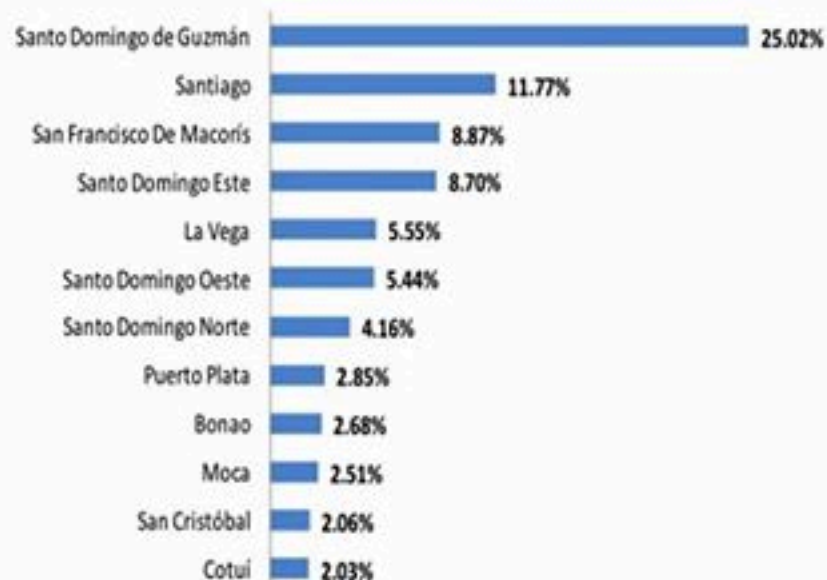
Figura 2. Casos de COVID-19 según municipio de residencia, República Dominicana, 27/04/2020.

El 54.19% (3477/6416) de los casos confirmados son hombres. La mediana de edad de los casos confirmados a nivel nacional es de 43 años.