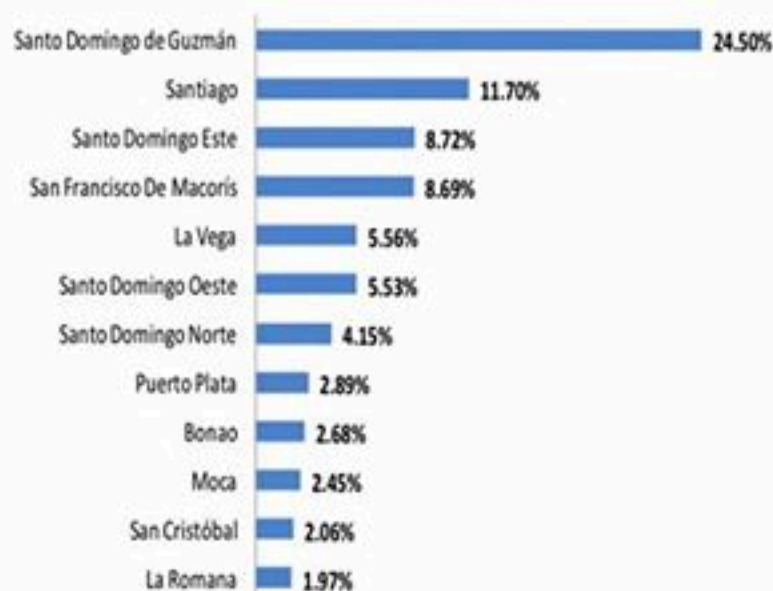
Figura 2. Casos de COVID-19 según municipio de residencia, República Dominicana, 28/04/2020.

El 54.12% (3600/6652) de los casos confirmados son hombres. La mediana de edad de los casos confirmados a nivel nacional es de 43 años.