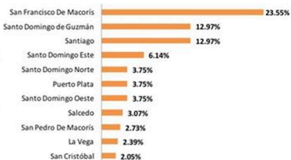
Figura 4. Defunciones por COVID-19, según municipio de residencia. República Dominicana, 28/04/2020.

Entre los antecedentes se reportan hipertensión arterial (29%) y diabetes (23%).