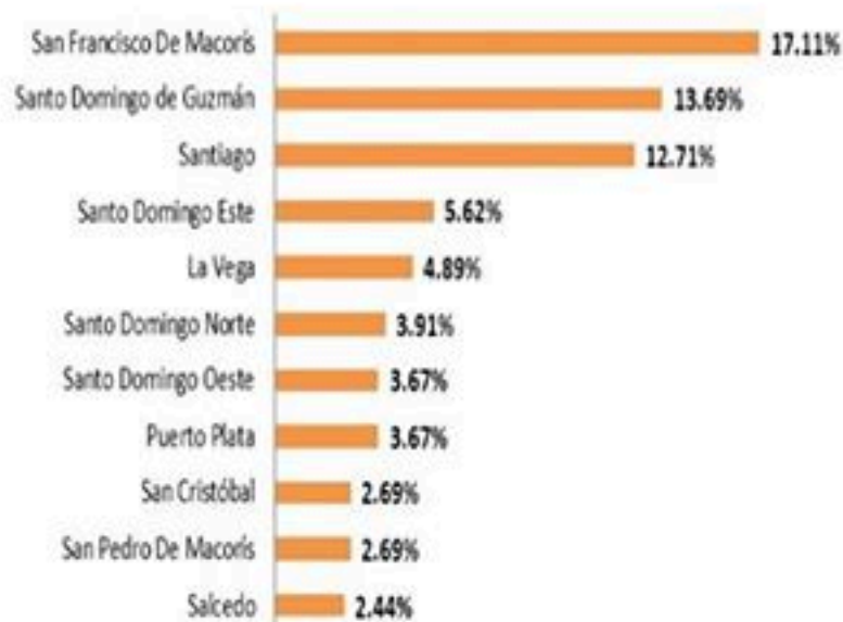
Figura 4. Defunciones por COVID-19, según municipio de residencia. República Dominicana, 12/05/2020.

Hasta el 12 de mayo, se han reportado 409 defunciones.