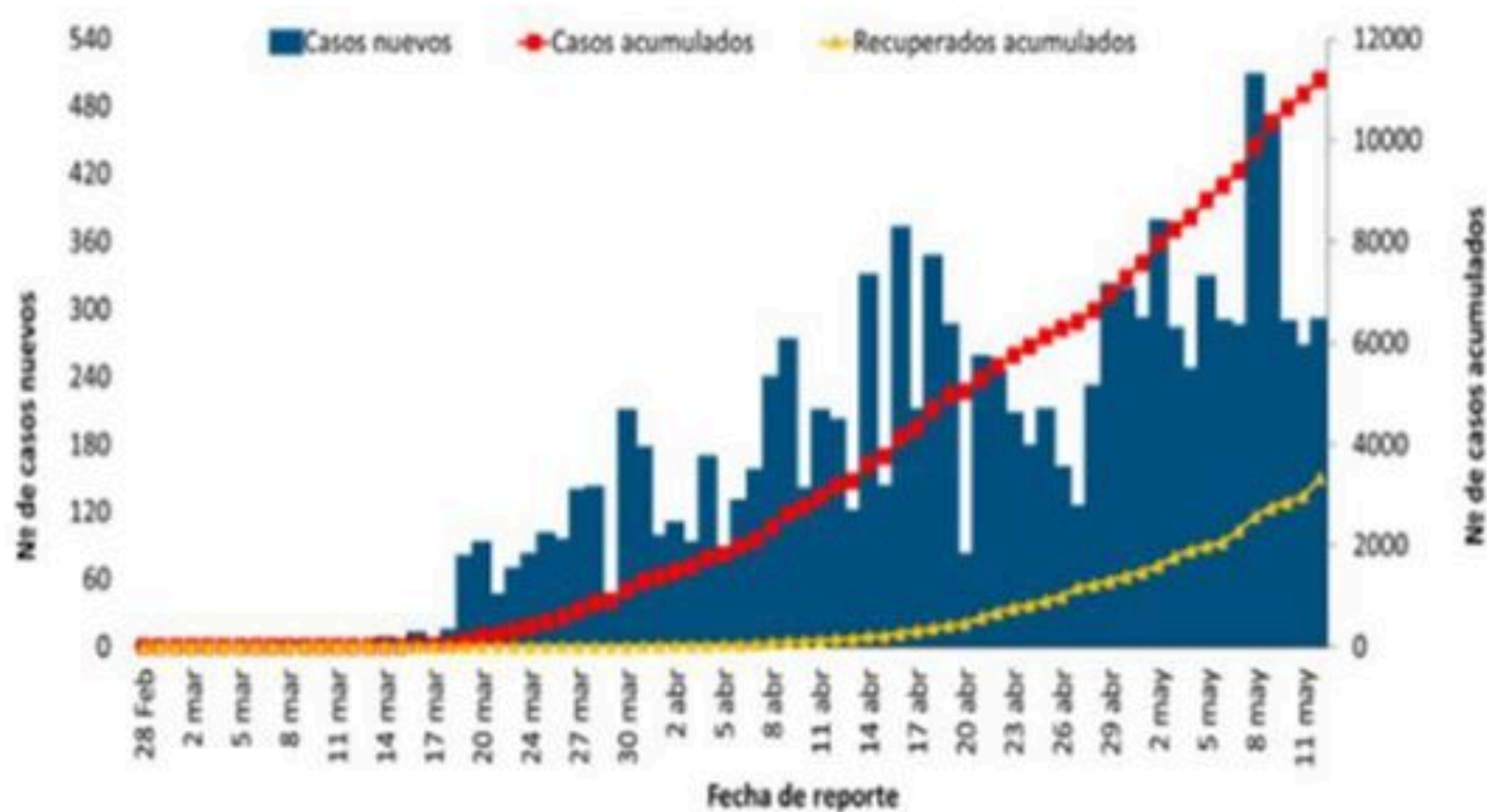
Figura 2. Casos confirmados de COVID-19 según municipio de residencia, República Dominicana, 12/05/2020