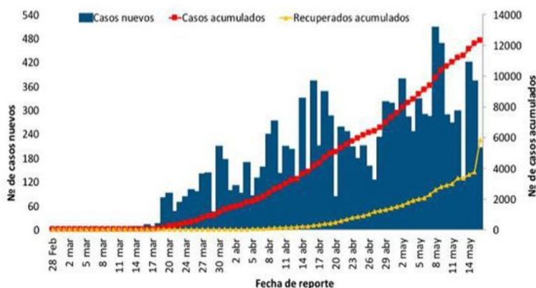
Figura 1. Casos confirmados nuevos, acumulados y recuperados de COVID-19 según fecha de reporte. República Dominicana, 16/05/2020