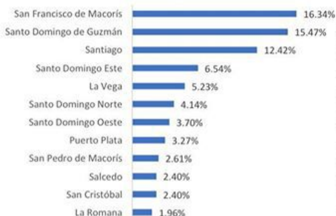
Figura 2. Defunciones por COVID-19, según municipio de residencia. República Dominicana, 24/05/2020.

Hasta el 24 de mayo, se han reportado 460 defunciones.