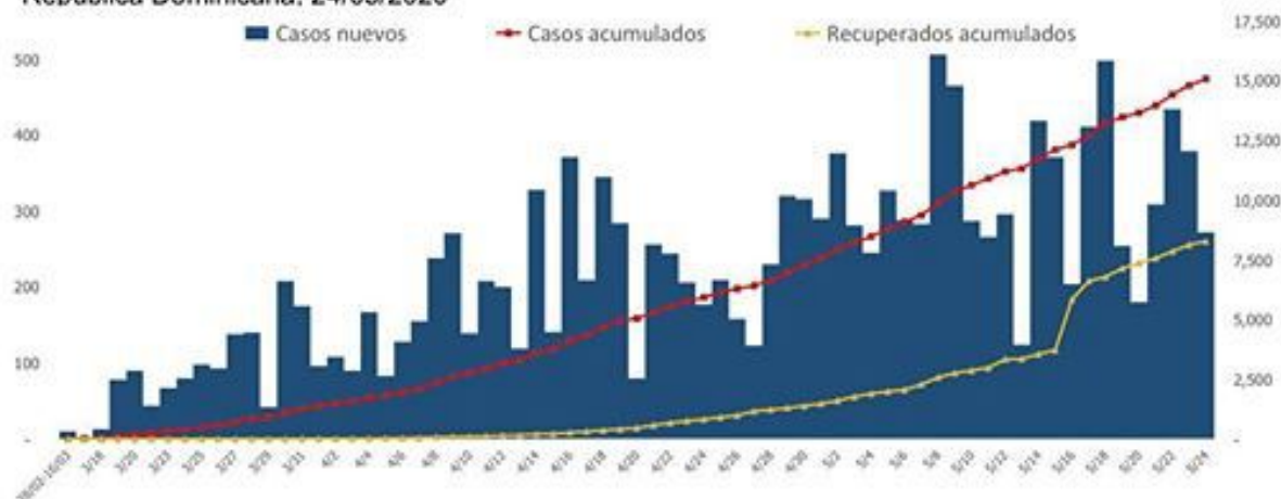
Figura 1. Casos confirmados nuevos, acumulados y recuperados de COVID-19 según fecha de reporte. República Dominicana, 24/05/2020

Mediana de edad del total de casos: 41 años. El 54.47% (8,211) son hombres y el 80.87% (12,189) de los casos se concentra en 12 municipios. En las últimas 4 semanas, la positividad en las muestras procesadas es de 18.96%