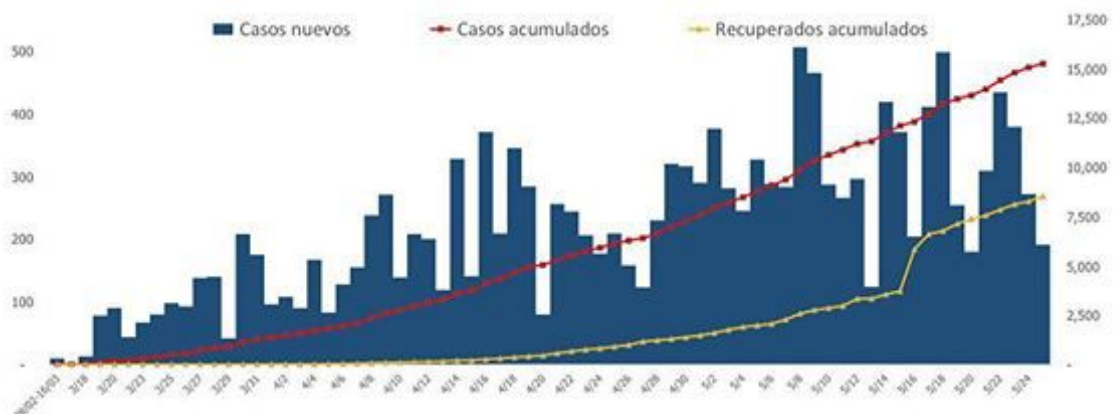
Figura 1. Casos confirmados nuevos, acumulados y recuperados de COVID-19 según fecha de reporte. República Dominicana, 25/05/2020

Mediana de edad del total de casos: 41 años. El 54.49% (8,318) son hombres y el 80.93% (12,353) de los casos se concentra en 12 municipios. En las últimas 4 semanas, la positividad en las muestras procesadas es de 18.84%