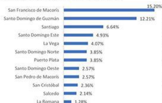
Figura 2. Defunciones por COVID-19, según municipio de residencia. República Dominicana, 25/05/2020.

Hasta el 25 de mayo, se han reportado 468 defunciones.