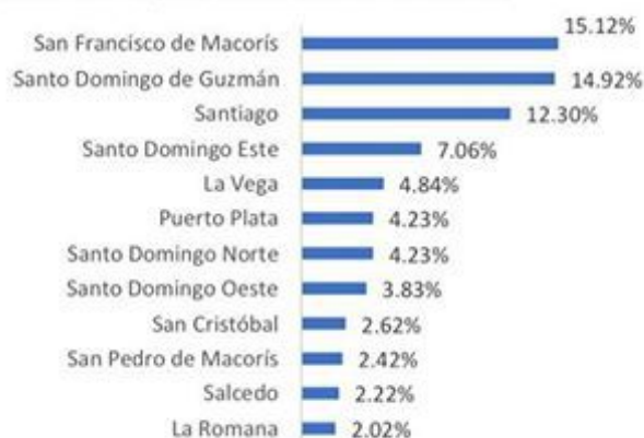
Figura 2. Defunciones por COVID-19, según municipio de residencia. República Dominicana, 29/05/2020.

Hasta el 29 de mayo, se han reportado 498 defunciones.