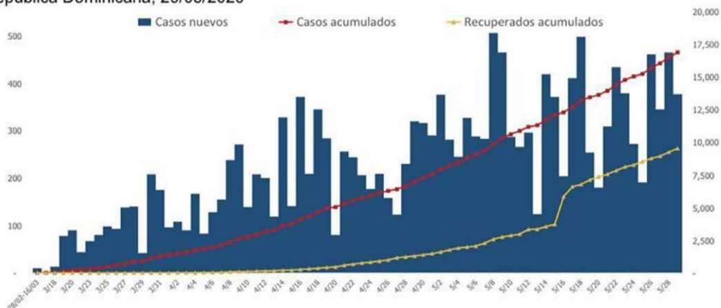
Figura 1. Casos confirmados nuevos, acumulados y recuperados de COVID-19 según fecha de reporte. República Dominicana, 29/05/2020

Mediana de edad del total de casos: 41 años. El 54.73% (9,254) son hombres y el 79.48% (13,438) de los casos se concentra en 12 municipios. En las últimas 4 semanas, la positividad en las muestras procesadas es de 18.93%.