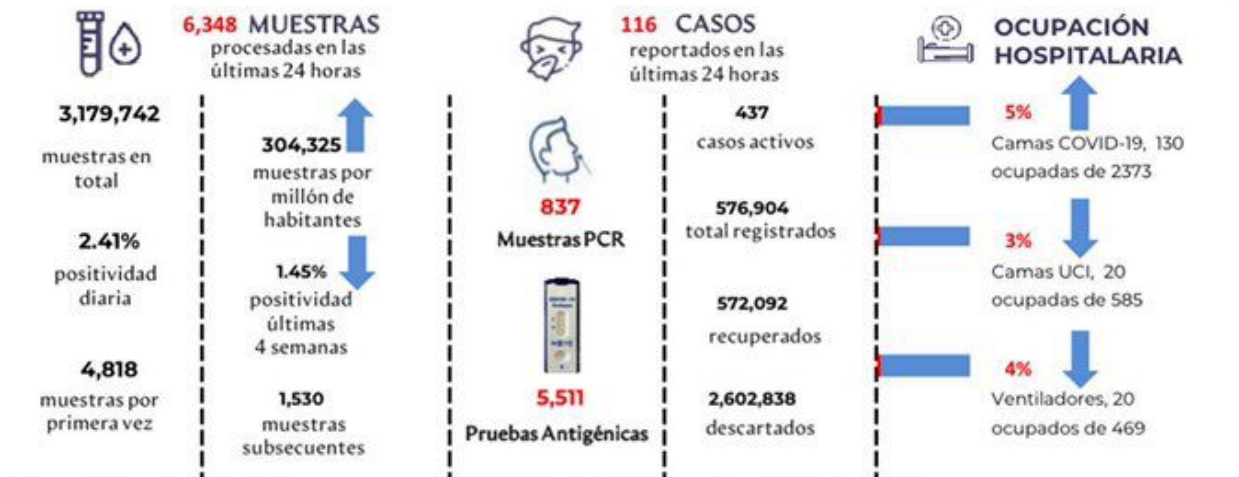
Figura 1. Tendencia de los casos y positividad de COVID-19 en República Dominicana