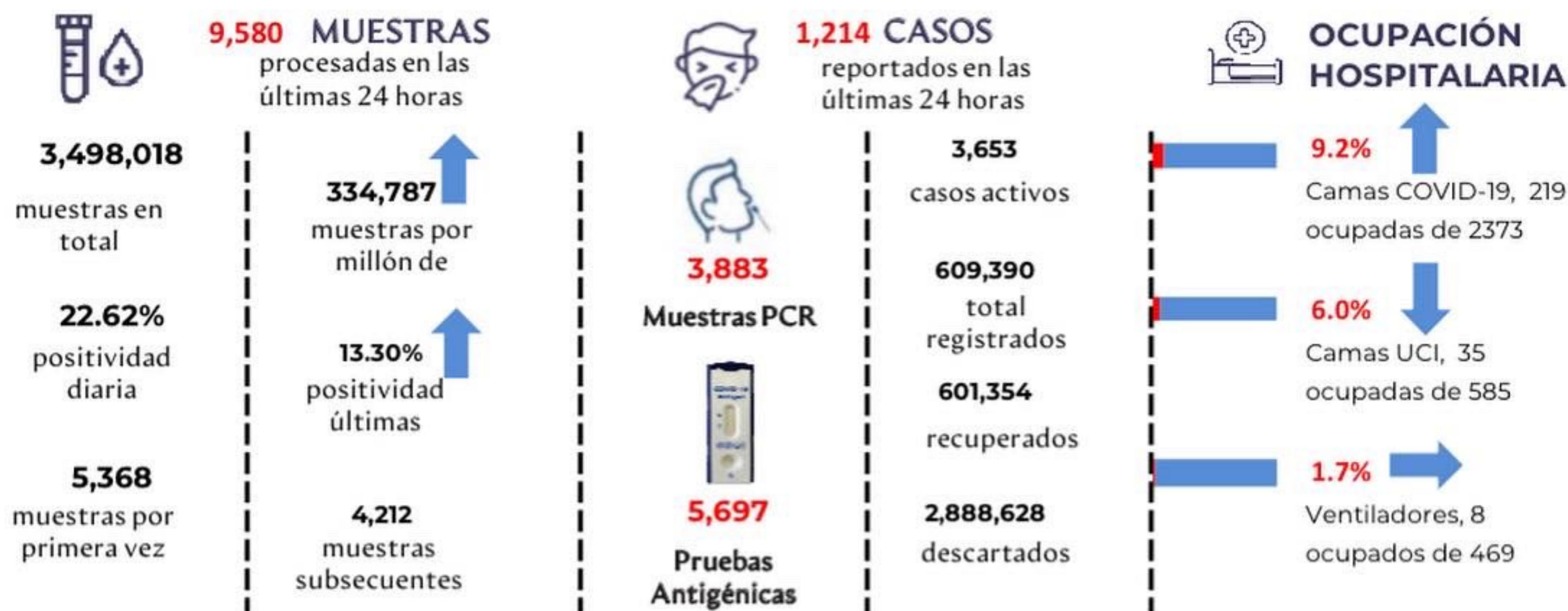
Figura 1. Tendencia de los casos y positividad de COVID-19 en República Dominicana