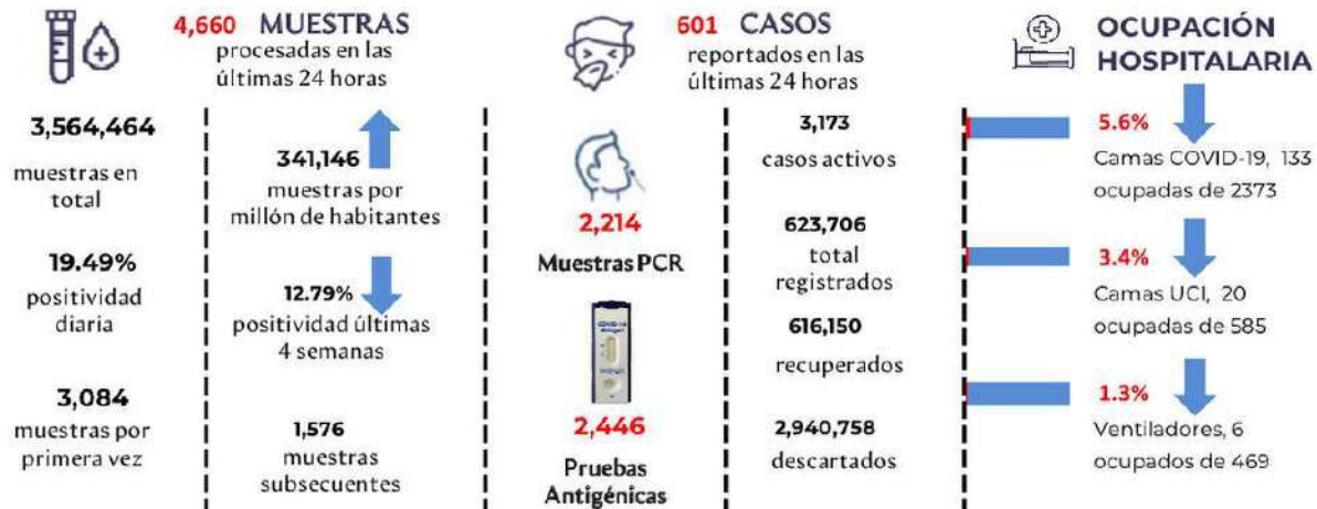
Figura 1. Tendencia de los casos y positividad de COVID-19 en República Dominicana