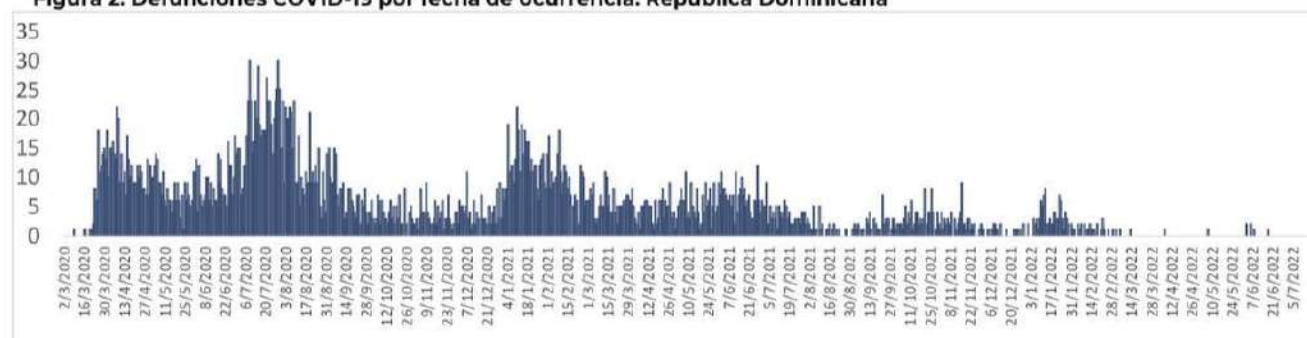
Figura 2. Defunciones COVID-19 por fecha de ocurrencia. República Dominicana