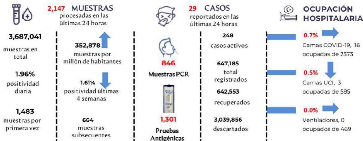
Figura 1. Tendencia de los casos y positividad de COVID-19 en República Dominicana